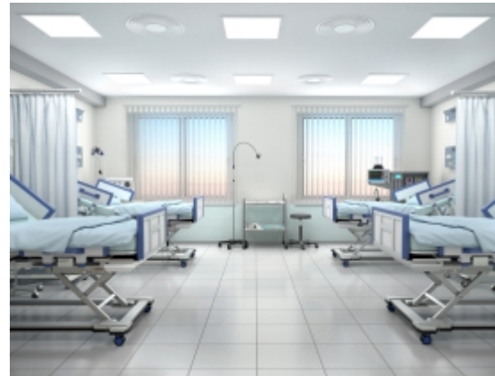
پودر بندکشی آنتی باکتریال ژیکاپوند مخصوص مکان هایی نظیر بیمارستان، مراکز بهداشتی و درمانی، رستورانها و استخرها